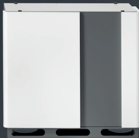
S10 SE BATTERIEFACH